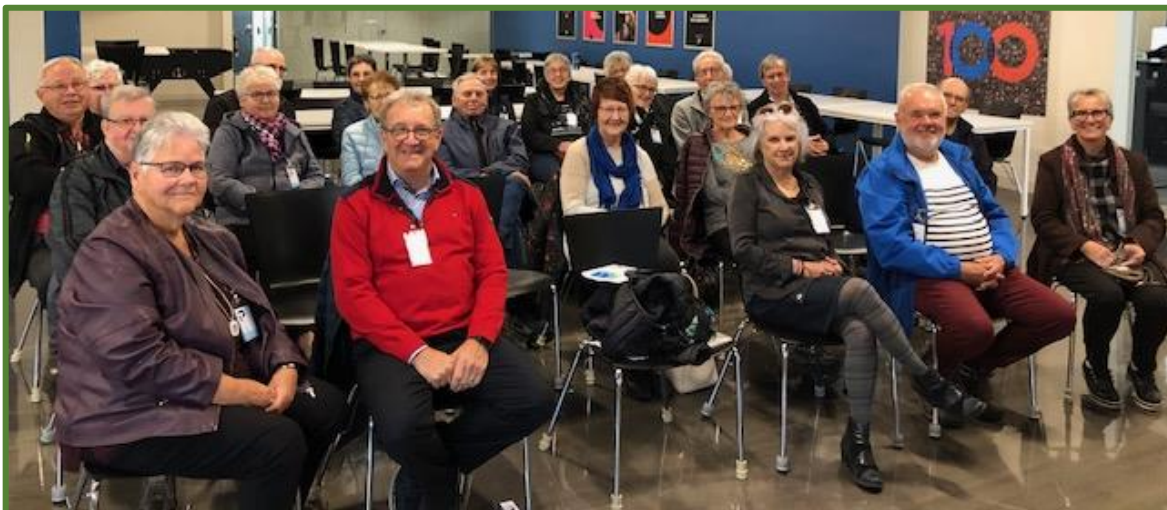
(Visite du siège mondial de Premier Tech à Rivière-du-Loup, le 19 octobre 2023)

Tél. : 418 724-1661 ou 1 800 511-3382, poste 1661