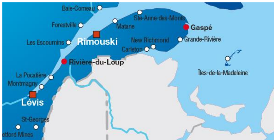
Territoire naturel de l'UQAR

L'ADAUQAR est un organisme à but non lucratif qui a pour mission d'offrir, en partenariat avec l'UQAR, des activités d'apprentissage diversifiées à l'intention des adultes de 50 ans et plus qui souhaitent demeurer actifs sur territoire naturel de l'UQAR, constitué du Bas-Saint-Laurent, de la grande région de la Gaspésie et des Îles-de-la-Madeleine et éventuellement le secteur ouest de la Côte-Nord ainsi que la Chaudière-Appalaches.